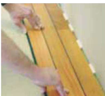
Obr. 5 Pokládka