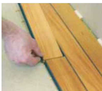
Obr. 4 Pokládka