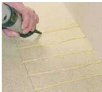
Obr. 1 Lepení k podkladu lepidlem Navycol PU