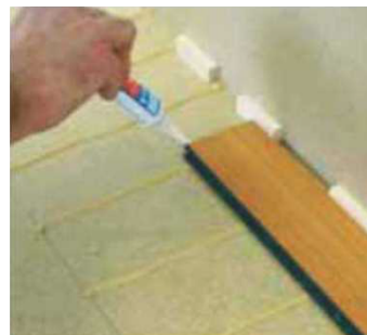
Obr. 3 Navycol+ na konci lamel