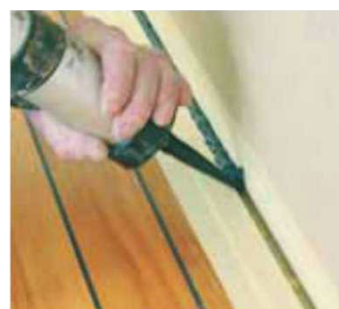
Obr. 6 Zatmelení podlahy po obvodu tmelem Navyjoint