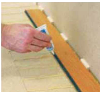
Obr. 2 Přilepení těsnícího proužku lepidlem Navycol+